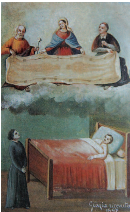
1897, Casalgrasso (Cn), Santuario Madonna delle Grazie