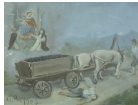
1900, Asti, Madonna di Pompei. Incidente con un carro carico di uva trainato da buoi

schematica e allusiva del tempo e dello spazio nel racconto; dall'accentuazione dei valori antinaturalistici nelle figure e nel paesaggio; dalla resistenza all'evoluzione stilistica convenzionale di forme e immagini; infine, da un intrigante rapporto con l'arte cosiddetta "colta". Il patrimonio degli ex-voto, in particolare quello delle tavolette dipinte, nel territorio piemontese è cospicuo; costituisce un capitolo rilevante dei beni culturali conservati negli edifici religiosi della nostra regione. Alle varietà di Madonne e Santi venerati e illustrati nelle tavolette degli ex-voto, si aggiunge anche la presenza congiunta della raffigurazione della Sindone, che giunta in