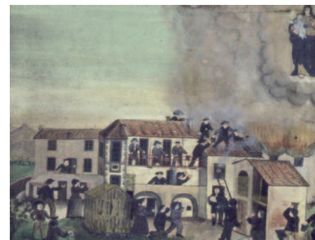
1909, 11 luglio, Molare (Al), Santuario Madonna delle Rocche. Tre famiglie spengono un forte incendio scoppiato alla cascina del Cereto

Piemonte dalla Savoia al principio del Cinquecento, forse tramite la Valle di Lanzo, assume il suo acme e la sua importanza per la storia della devozione e delle immagini con la Controriforma (pellegrinaggio di San Carlo Borromeo dalla vicina Lombardia per sciogliere il voto fatto in occasione della peste del 1576) e, successivamente, in occasione delle Ostensioni della sacra reliquia, nell'età barocca. La mostra fornisce preziose indicazioni anche relativamente alle categorie di voti sciolti e raffigurati: malattie, infortuni domestici e sul lavoro, guerre, calamità naturali, incidenti sul mare. I committenti riguardano invece la varietà dei richiedenti la grazia: età, ruolo e classi sociali di apparte-