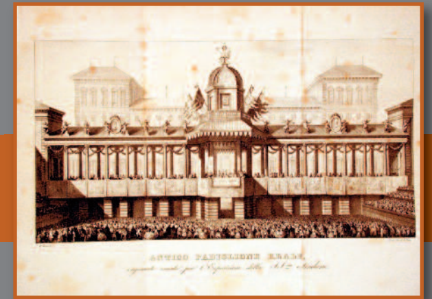
Re. f. 2/1