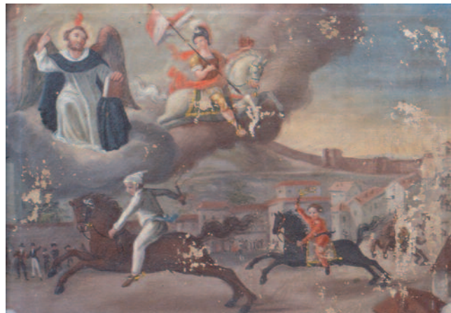
1826, 22 maggio, Celle Enomondo (At), Cappella della Merlazza dedicata a S. Vincenzo Ferreri. Il fantino di Celle (ritratto nel costume del tempo) ricorda la vittoria al Palio di Asti sotto la protezione di S. Vincenzo Ferreri e S. Secondo (patrono di Asti) che – come recita il cartiglio – su di un cavallo sardo, corse, si divertì e vinse nuovamente. Gli ex-voto raccontano dunque anche storie di vittoria, di gioia, non solo di dolore

schematica e allusiva del tempo e dello spazio nel racconto; dall'accentuazione dei valori antinaturalistici nelle figure e nel paesaggio; dalla resistenza all'evoluzione stilistica convenzionale di forme e immagini; infine, da un intrigante rapporto con l'arte cosiddetta "colta". Il patrimonio degli ex-voto, in particolare quello delle tavolette dipinte, nel territorio piemontese è cospicuo; costituisce un capitolo rilevante dei beni culturali conservati negli edifici religiosi della nostra regione. Alle varietà di Madonne e Santi venerati e illustrati nelle tavolette degli ex-voto, si aggiunge anche la presenza congiunta della raffigurazione della Sindone, che giunta in