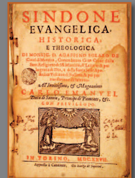
D. VIII 248/1

La Biblioteca Nazionale Universitaria di Torino conserva tra i suoi fondi numerose testimonianze bibliografiche sulla Sindone. I manoscritti, le stampe e i libri antichi presentati nel percorso espositivo evidenziano l'importanza che la casa Savoia attribuì al culto del Sacro Lino, non solo come ricordo da venerare ma anche simbolo del potere dinastico e politico della casata.