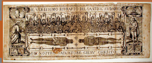
q. VII. 48