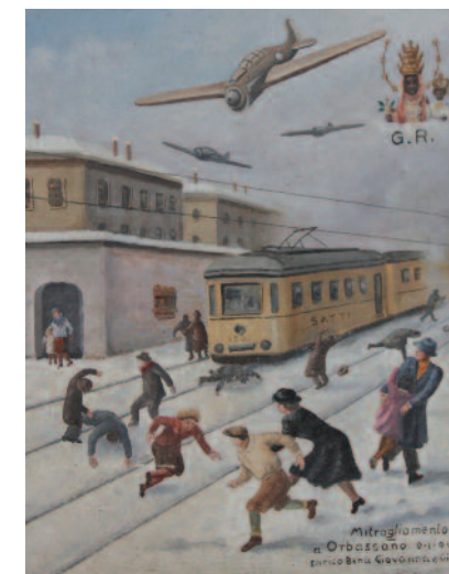
1944, 9 gennaio, Biella (Bi), Santuario Madonna di Oropa. Mitragliamento di aerei su Orbassano (To)

nenza. È un dato quest'ultimo di particolare rilevanza per la messa a fuoco della recezione di questa tipologia di immagini; quindi del suo significato sociale e simbolico. La precisazione di tutti questi problemi e punti di vista, unitamente all'ampia bibliografia di riferimento italiana e straniera elencata, diventano indispensabile riferimento per quanti si accingano a studiare questa tipologia di arte popolare.