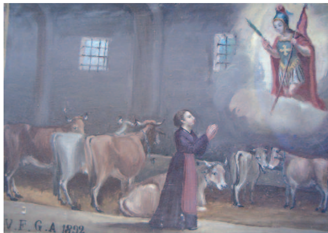
1892, Pianezza (To), Santuario di San Pancrazio. Donna invoca protezione per gli animali nella stalla [foto R. Grimaldi, 2015]

L'ex-voto è un oggetto d'arte cosiddetta "popolare", che rispetto alle altre opere d'arte, presenta differenti caratteri di funzione, valori d'uso, modi di linguaggio ed espressione. Manufatti artigianali singolari, gli ex-voto sono importanti documenti della devozione e della religiosità di una comunità; testimonianze di un rapporto particolare tra uomo e mondo soprannaturale; di memoria e riconoscenza tangibile di un evento taumaturgico, considerato eccezionale, che spesso si colloca tra storia e leggenda; molto simile, per alcuni aspetti, alla reliquia. Sotto il profilo formale, gli ex-voto, in particolare quelli effigiati sulle tavolette dipinte, sono accumulati dalla rappresentazione